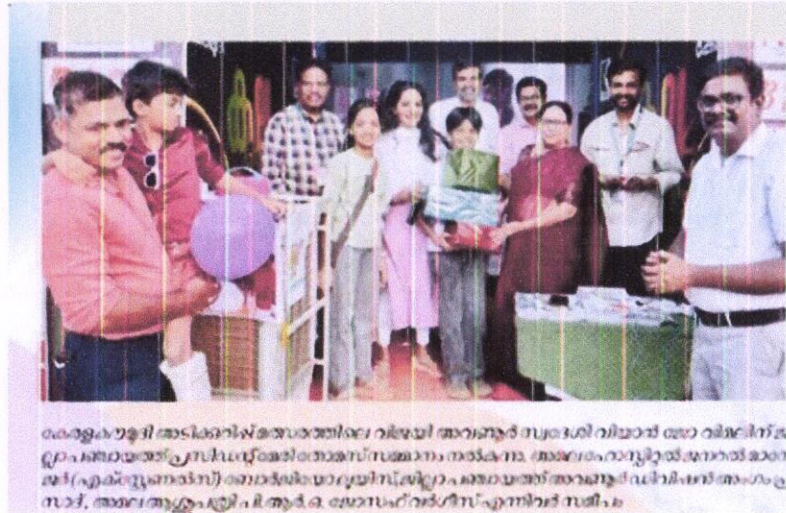
മെമ്മോറിയൽ അടവുവെച്ചു നൽകിയ അമ്മമാർക്ക് സമ്മാനമായി ഒരു വിദ്യാർത്ഥിനിക്ക് പ്രൊഫഷണൽ സർവ്വീസിൽ അദ്ധ്യാപനം നൽകാനും അമ്മമാർക്കായിട്ടുള്ള അക്കാദമിക് സെമിനാറുകളിൽ പങ്കെടുക്കാനും സാധിക്കുന്നതിനും ഉദ്ദേശിച്ചാണ് സമ്മാനം നൽകിയത്. അമ്മമാരുടെയും കുട്ടികളുടെയും നന്മയ്ക്കാണ് സമ്മാനം നൽകിയത്.